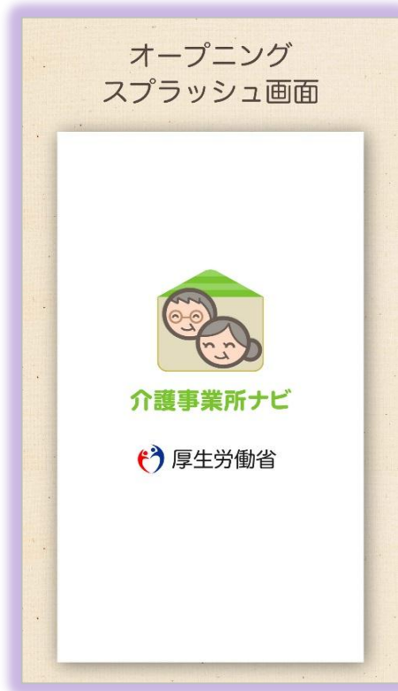
厚生労働省のクレジット