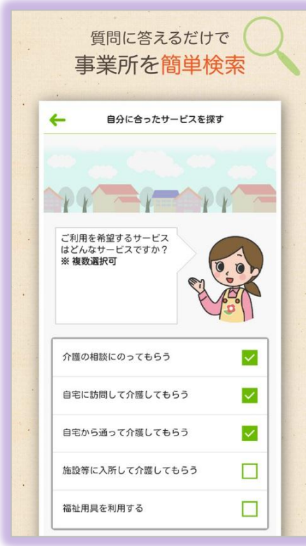
介護サービスに詳しくない方には質問形式で誘導