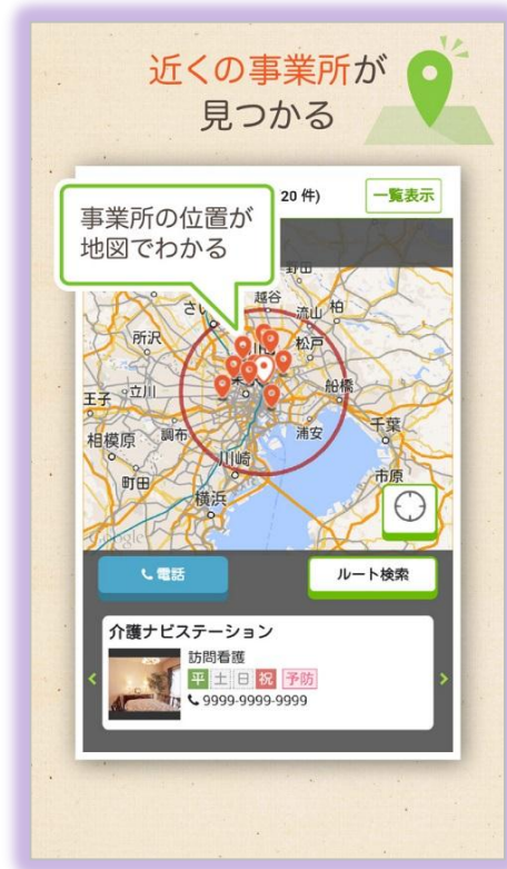
現在地からの距離や道順が分かる