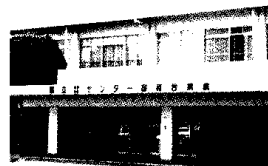
国府台病院 Kohnodai Hospital