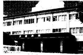
武蔵病院 Musashi Hospital

The NCNP still has some issues to be overcome in order to fulfill our mission. However, the NCNP will be recognized as one of leading medical centers and be committed to providing the general people the highest quality health care. Hoping our humane and healthy future, all staffs of the NCNP are working together to give the best treatment, information and support to the patients and families in our care. We ask you, therefore, your kind support and cooperation.