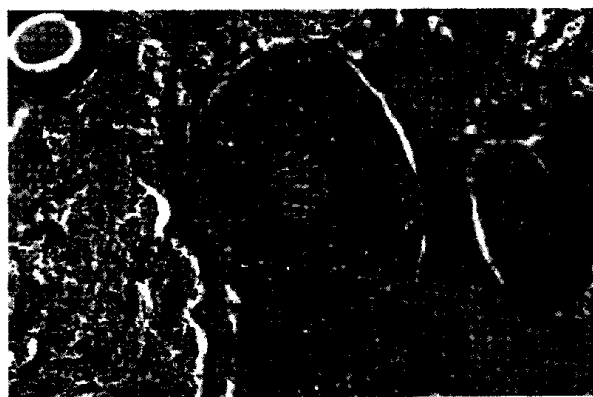
図4.4 1996年に英国マージー川河口で採取した雄カレイ ( Platichthys flesus ) の精巣切片。異常な精子細胞組織に沿って大型の二次卵母細胞(卵巣精巣)がいくつか見られる。

4.5.2.2.1 下水処理場排水による生殖腺発生への影響 魚類における生殖腺発生の異常について最初に報告されたのは、前節で示した VTG 誘導に付随して観察された事例である。このデータの大部分もまた英国における STW 排水への魚類の暴露実験で得られたものであった。これらの魚類は明らかに汚染物質のエストロゲン作用により影響を受けていた。アルキルフェノールに汚染されたエア川などのような、エストロゲン様化合物に激しく汚染された水の中に放置したニジマスの成魚で、精巣の発育阻害が観察された (Harries et al., 1997)。実験室において、ニジマスを実際の環境と同程度の濃度のアルキルフェノールに暴露すると、精巣の発育に同様な影響がみられた (Jobling et al., 1996)。また、英国のいくつかの川において STW 排水の下流で