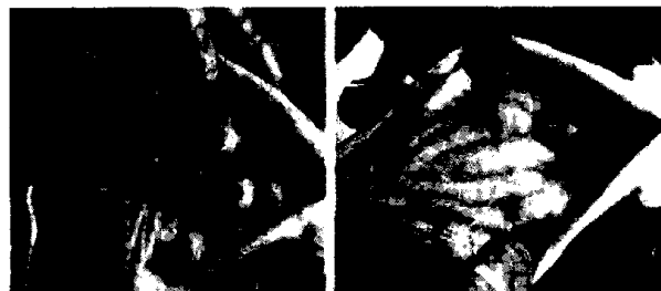
図4.5 産卵回遊期間中に採取したホワイトサッカード ( Catostomus commersoni) の卵巣。左側の魚は、スベリオル湖僻地の未開発地域(マウンテン湾)に生息する個体群から採取した。右側の魚は、カナダ、オンタリオ州、テラス湾の工場からBKMEが流入するスベリオル湖のジャックフィッシュ湾に生息する個体群から採取したものである。BKMEに暴露される場所由来の魚では、卵巣サイズが著しく縮小していた。