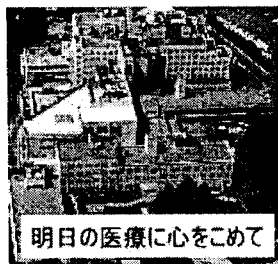
日立総合病院 Hitachi General Hospital