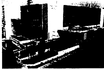
岡崎市医師会公衆衛生センター

担当医師: 岡崎市医師会小児科専門医 14名 愛知県下3大学小児科からの派遣医師