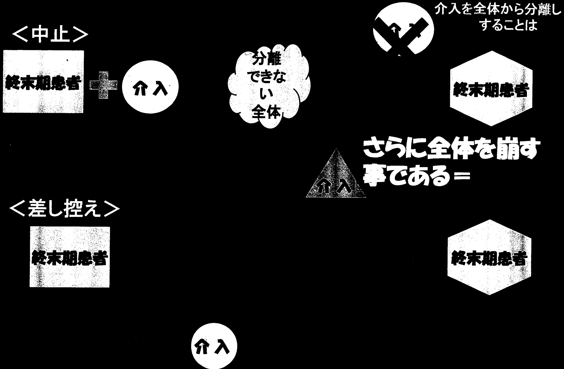
図2 身体を統一された全体と考えた場合には、「差し控え」と「中止」は異なる