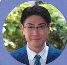
特別養護老人ホーム あんり 施設長