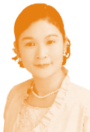
たけがみ かずみ 竹上 和見氏 (ラジオパーソナリティー) 京都府出身のアナウンサー。 コマーシャル、ナレーション、司会 などでも活躍し、主な出演番組 はKBS京都ラジオ「早川一光 のぼんざい!!人間」など。