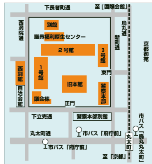
京都府庁職員福利厚生センター地図

株式会社ウイングスマルコー 配送センター 〒601-8121 京都市南区上鳥羽大物町29