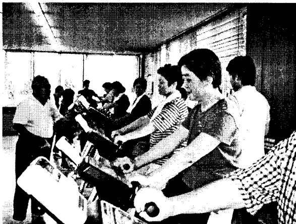
ヘルスアップセミナー 筋力測定