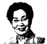
熊本県知事 潮谷 義子氏