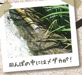
田んぼの中にはメダカが!