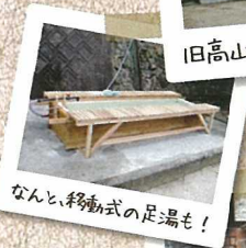
なんと、移動式の足湯も!