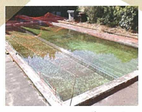
ニジマスの養殖場

右に行くと「清流」の方へ 左に上がると地区公民館の駐車場 → 巴ヶ窯に着きます。