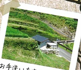
お手洗いもあるんです♪