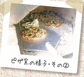
巴ヶ窯の様子・その②

巴ヶ窯下のハートのマークは、平鹿倉地区の方がデザインしたもので、あよとしたところにもこだわりが見える、地区の方による手作りの巴ヶ窯なんです！