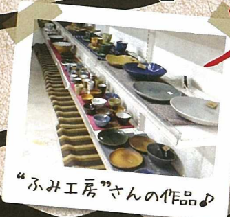
“ふみ工房”さんの作品♪