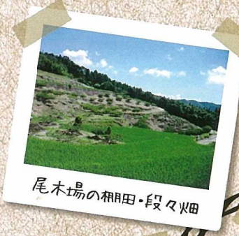
尾木場の棚田・段々畑