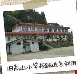
旧高山小学校跡地を利用