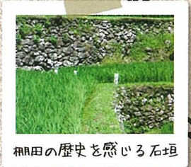
棚田の歴史を感じる石垣