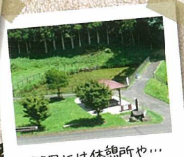
棚田には休憩所や...