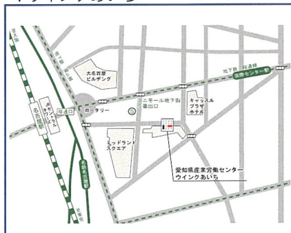
▼日本福祉大学名古屋キャンパス