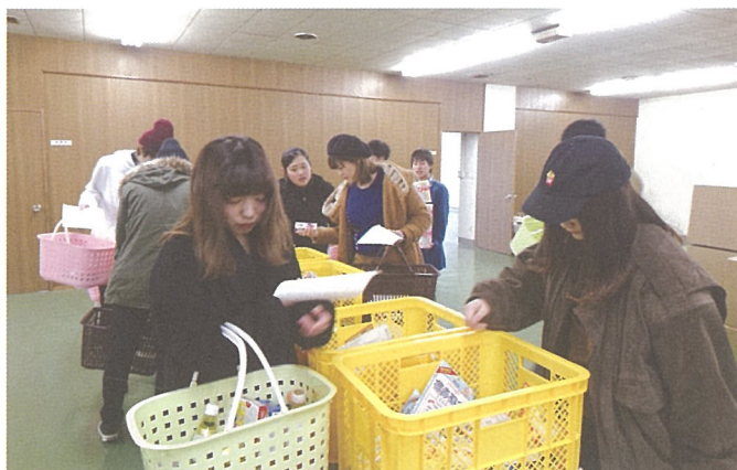
▲ 大学生ボランティア活動の様子