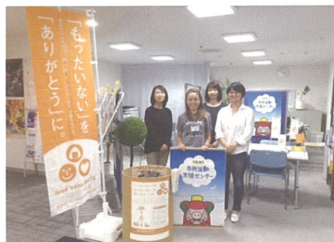
▲ 大船渡市市民活動支援センターさんのフードドライブ