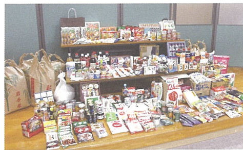
▲ 滝沢市社会福祉協議会さんのフードドライブで集めていただきました

2016年度は628件16,220.5kgの食料を市民、企業のみさんから提供していただきました。ご協力ありがとうございます。下の表にある通り、夏休みや冬休みなどの給食がなくなる長期休暇前には支援の要請が増え、より多くの食料品が必要となっています。