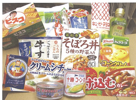
▲ 提供する食料品セットの例