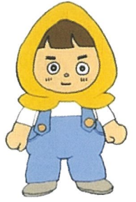
防災教育事業の イメージキャラクター