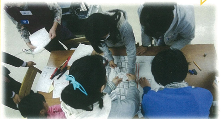
地域の方と一緒に避難所運営ゲームで学ぶ 一本松小学校の6年生