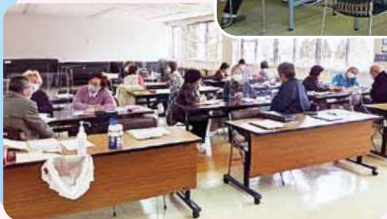
山元町フォローアップ講座