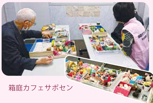
箱庭カフェサポセン