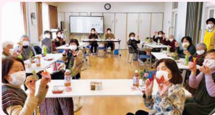
傾聴カフェ 美田園北集会所