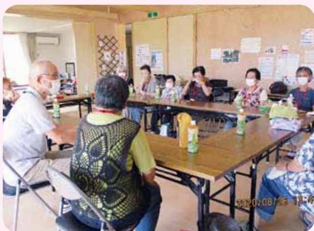
傾聴カフェ 荒井東市営住宅

今後は、行政や各方面のご指導を賜りながら、復興住宅やカフェの中での心のケア、傾聴活動を継続してまいりたいと考えています。