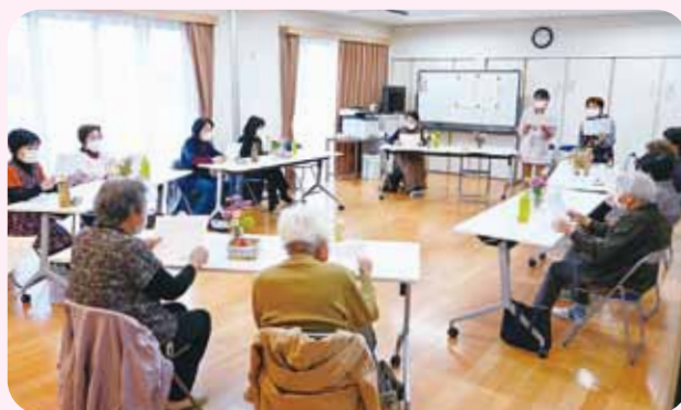
傾聴カフェ 美田園北集会所