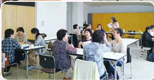
白石市、アイキララ交流研修会