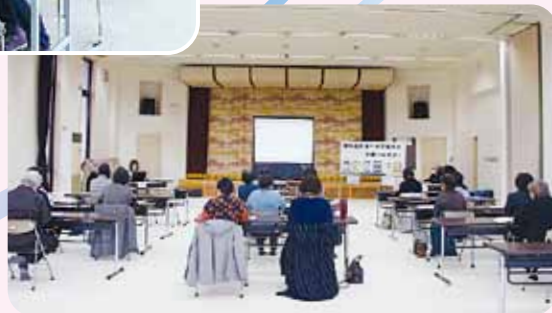
大和町フォローアップ講座