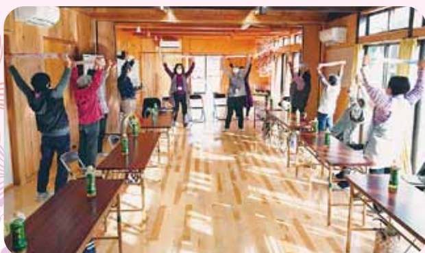
傾聴カフェ 南相馬市南町団地集会所