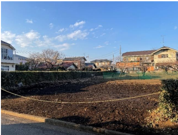
垣根を伐根し新設した出入り口 (株式会社アグリメディアにより)

遊休地となっている生産緑地の活用実績のある株式会社アグリメディアに依頼し、倉庫の新設、垣根を伐根し出入り口の整備、駐車スペースの転圧、境界ネット、雨水タンク設置等を行いました。その他の資材置き場や休憩スペース等は、くにたち社協職員と参加者で力を合わせ現在も少しずつ整備し続けています。