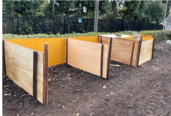
残渣置場の新設 (当事者と社協職員により)