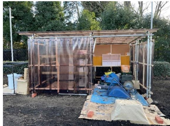
新設した倉庫 (株式会社アグリメディアにより)