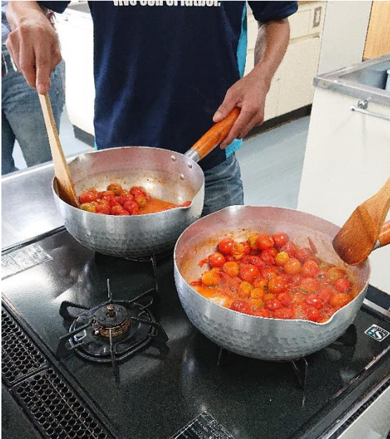
←収穫した野菜を調理 (ミニトマトピューレ作り)