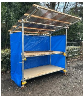
資材置き場の新設 (当事者と社協職員により)