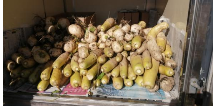
御殿場の農家さんが寄贈して下さいました大根と蕪。感謝！

新年も1月2日早々に、乳製品のロスを防ぐために大量の牛乳やヨーグルトを配布しました。お屠蘇でお節