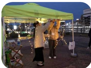
無料中高生カフェMUSUBIの準備中