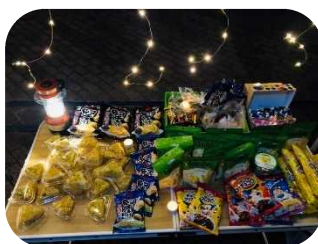
お菓子やおむすび・日用品を配布