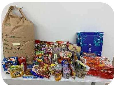
常妙寺様から、たくさんの食品のご寄付をいただきました。フードパントリーでひとり親家庭へお届けできました。