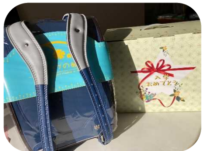
ランドセルのご寄付をいただきました。新小學生にプレゼントすることができ、とても喜ばれました。