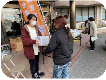
おせちの配付様子

「電気代や食品の値上がりが続く、年末年始も何かと出費が多いので、助かります」と話される方もあり、食品配付が少しでも家計の支えになればと思います。