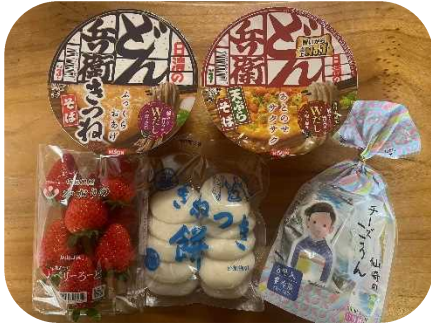
年越しそばやお餅、いちごなどをお渡ししました