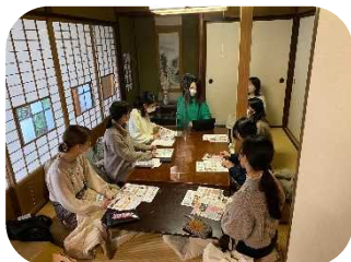
ソーシャルワークセンターつばさでの説明