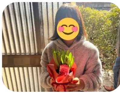
Flower Factory LITOFU様から、クリスマスにちなんでヒヤシンスのご寄付をいただきました。