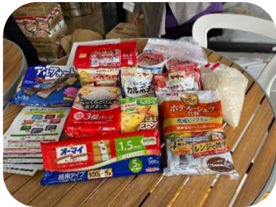
配付会でお渡しした食品