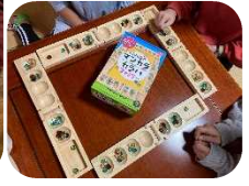
ポップコーンメーカーを使っている様子。ボードゲームで遊んでいる様子。映画のおともを楽しみました。