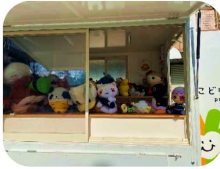
ぬいぐるみのご寄付。食品と一緒にお渡ししました。