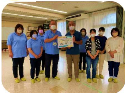
明治安田生命保険相互会社山口支社 山口営業所の皆様から、ご寄付を頂きました。