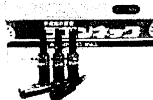
【注射薬 ラエンネック】 肝臓疾患における肝機能の改善