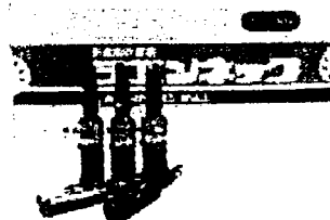
【注射薬 ラエンネック】