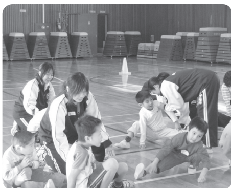
準備体操でも丁寧に指導

カナナ この教室には健常のお子さんでちよつと運動が苦手という子や、障害を持つ子の兄弟たちも参加して、お互いを知り合うチャンスにもなっているそうです。この教室に兄弟で参加させているお母さんは、次のようにお話を伺いました。