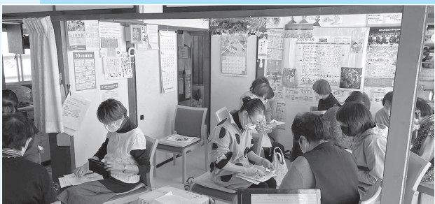
2回開催したボランティアの勉強会には延べ30人が参加した。ボランティア活動や認知症への理解を深め、支援の担い手を育成することを目指した

くないため、認知症の人と元気シニアが会話を楽しみながら作業することができました。活動後には参加者から感想をいただき、困りごとや作業環境への要望があれば、すぐに対応して作業しやすい環境をつくっています」。 支援実績として、企業での電線カット作業は28回、「ふれあいにこにこの丘」での銅線取り出し作業は20回実施し、認知症当事者5人、元気シニア11人、ひきこもり当事者5人が参加した。