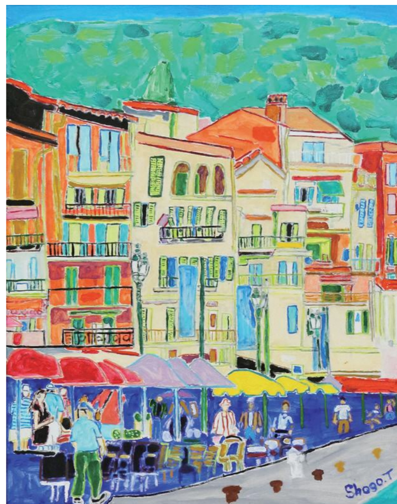
平成30年度 絵画の部 京都市長賞「カラフルな街」戸所隼吾