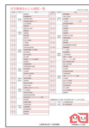
在宅療養あんしん病院一覧