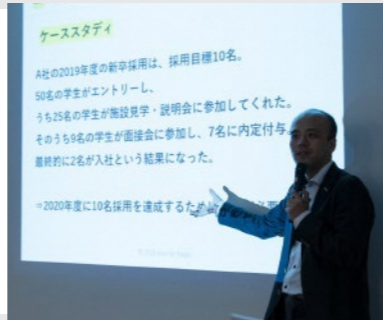
※昨年のプログラム時の様子です。今年はオンライン開催になります。