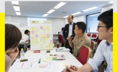
※昨年のプログラム時の様子です。今年はオンライン開催になります。