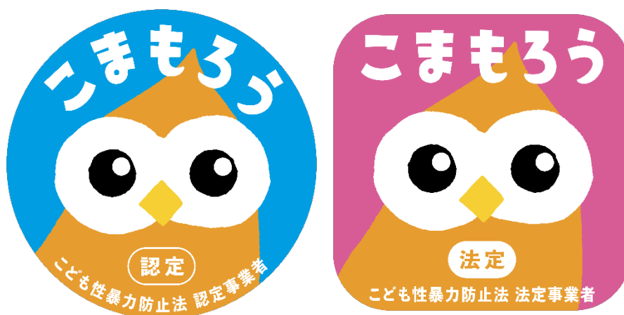
(左：認定事業者マーク、右：法定事業者マーク)