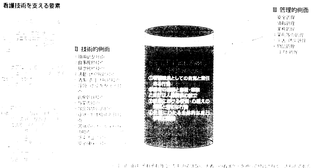
図2 臨床実践能力の構造

看護は必要な知識、技術、態度を統合した実践的能力を、複数の患者を受け持ちながら、優先度を考慮し発揮することが求められる。そのため、臨床実践能力の構造として、Ⅰ基本姿勢と態度 Ⅱ技術的側面 Ⅲ管理的側面が考えられる(図2)。これらの要素はそれぞれ独立したものではなく、患者への看護を通して臨床実践の場で統合されるべきものである。また、看護基礎教育で学んだことを土台にし、新人看護職員研修で臨床実践能力を積み上げていくものである。