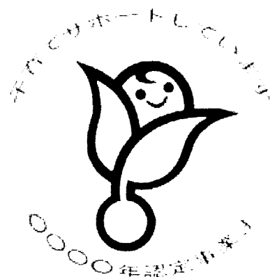
次世代認定マーク「くるみん」