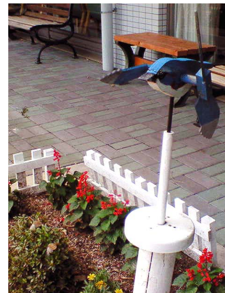
▲ 入居者の手作りオブジェ「鳥」