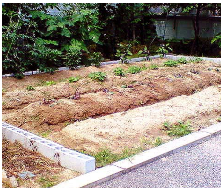
▲ 菜園と協働による収穫物 庭